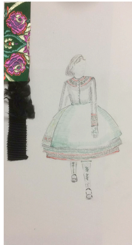
Kostuumontwerp Der Freischütz

Twee weken voor de repetities vond helaas een cast-wisseling plaats: