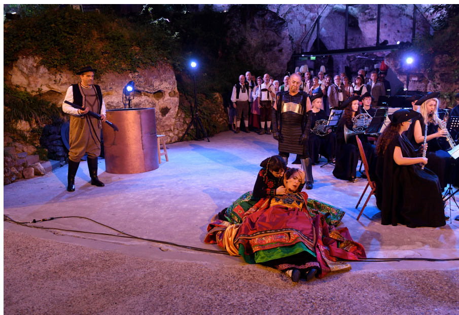
Eindscene Der Freischütz